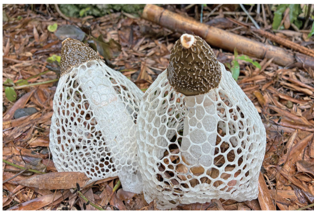
キノガサタケ / 悪臭が虫を誘う

腐ったような臭いを放ち、虫を呼び寄せて胞子を運ばせるキノガサタケなどのキノコは、「近づくな」ではなく、むしろ「来て来て」とメッセージを送っている。だが動物はその臭いを嫌い、食べるのを敬遠する。見た目や印象をうまく利用して、自分に都合のいい状況をつくっているわけだ。