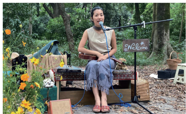
下鴨神社のイベントで手作り衣装を着て歌っている様子

ちゃんが見られます。そんな自然との触れ合いが、その気持ち育ててくれました。 私が逢った、少数民族の人達の衣装には、蓮の花や鳥などをモチーフにしたものがありました。もしかしたらそれは、彼らのスピリットや日々の景色と結びついているのかもしれない。 それなら私も、この町で出会った景色を歌い、敬い、創造してみよう。そう思ったときから、私の創作のテーマは「現代のフォークロア(※)創造」になりました。 この町の景色や生きもの達から生まれた、わらべ歌や民族衣装。いつか見に来てくださいなね。