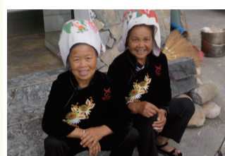
上 中国で撮影した苗族の女性 右上 木苺を手描きした染の作品(スクーフ)

ちゃんが見られます。そんな自然との触れ合いが、その気持ち育ててくれました。 私が逢った、少数民族の人達の衣装には、蓮の花や鳥などをモチーフにしたものがありました。もしかしたらそれは、彼らのスピリットや日々の景色と結びついているのかもしれない。 それなら私も、この町で出会った景色を歌い、敬い、創造してみよう。そう思ったときから、私の創作のテーマは「現代のフォークロア(※)創造」になりました。 この町の景色や生きもの達から生まれた、わらべ歌や民族衣装。いつか見に来てくださいなね。