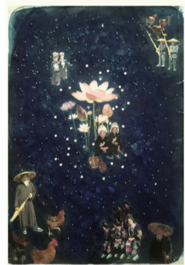
左上 中国で撮った写真を使ったコラージュ作品