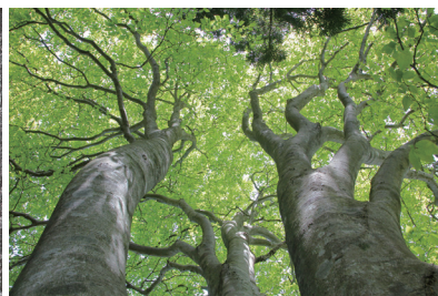
滋賀県三重嶽 (さんじょうがだけ)

また、プナの森は極相林と言われている。自然のまま人の手が入らなければ、長い年月の末、草地や疎林などはプナの森へ行き着くというもの。即ちプナの森は本来の自然の姿であるといふこと。それを美しいと思うのは当然のこと、そこに身を置くと心地よく安らぎを感じるのには当たり前のことと言える。そんなプナの生息域は地球温暖化や人間都合の伐採等の影響でどんどん狭められている。美しいと思わせ安らぎを与える存在が当たり前でなくなっている。そんな当たり前だと思っていたことが、昨今そうでなくなってきたということ、何もプナの森の話だけではなく、地球温暖化による異常気象など地球環境然り、戦争や紛争、分断や格差が常態化している世界情勢然り、「ミニユケーション」の取り方や人間関係などもそうだ。山に登ったり森を歩いたりすることは、二次的にはストレスを発散して健康維持という意味合いもあるのだが、このようにいろいろと考えさせられることが多く、かえってストレスにならないかと心配してしまう昨今である。