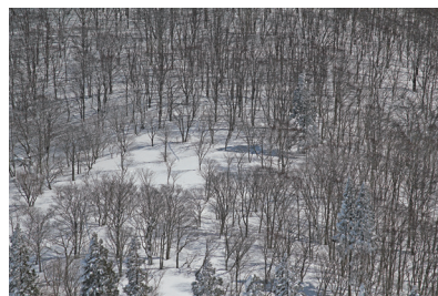
滋賀県比良山コヤマノ岳

プナは建材としては不向きで利用価値が低い木とされ、人の手により伐採され杉や桧に置き換えられてきた。杉や桧は常緑樹で、さらに密集して植えられることから地上に光が届かないため、植生は豊かではなく、そこに生きる生物も限られてくる。また、根が浅く、降った雨をたくさん貯め込むことができず、すぐに谷や川に雨水が流れ込むことで、河川の急激な水位上昇や土砂災害が起こりやすい。これに対して、プナなどは広く深く根が張り巡らされるときも、落葉による腐葉土が層になつているため、スポンジのように降った雨を貯め込むことができ、豪雨などの災害にも強いとされている。